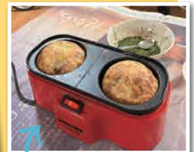
メガサイズ たこ焼き！